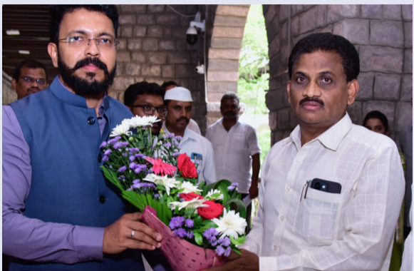
గుంటూరు, రక్షణ స్టూస్:

జిల్లా కలెక్టర్ను మర్యాదపూర్వకంగా కలిసిన నూతన అధికారి