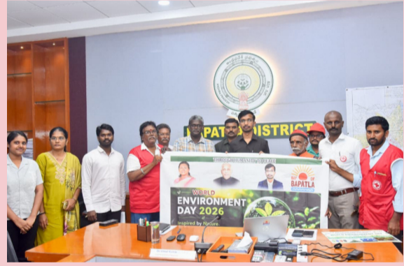
బాపట్ల, రక్షణ స్టాఫ్:

ప్రపంచ పర్యావరణ దినోత్సవ పోస్టర్, బ్యానర్ ఆవిష్కరించిన కలెక్టర్