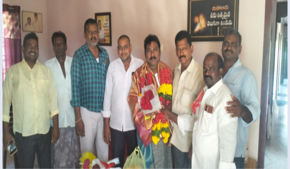
బాపట్ల, రక్షణ స్టూస్:

పండ్ల వ్యాపారుల ఘన సన్మానం.. ఎమ్మెల్యేకు కృతజ్ఞతలు