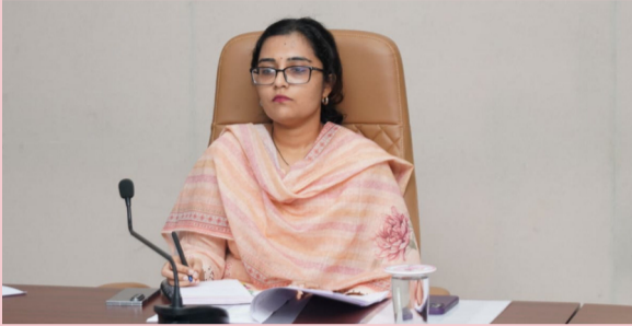
నరసరావుపేట రక్షణ స్టాఫ్:

జూన్ నెలాఖరులోగా ప్రక్రియ పూర్తి చేయాలని ఆదేశం